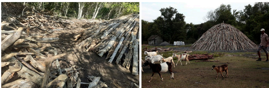
Figura: 3 Conformación del horno en el sitio previamente seleccionado y acondicionado.

La construcción de la pila de carbonización consiste en colocar alrededor del poste guía unos sostenedores de aproximadamente 1 m de longitud en un ángulo que mantenga la guía vertical. Estos sostenedores se atan firmemente, inmovilizando la guía y permitiendo el alzado y acomodamiento de la leña.