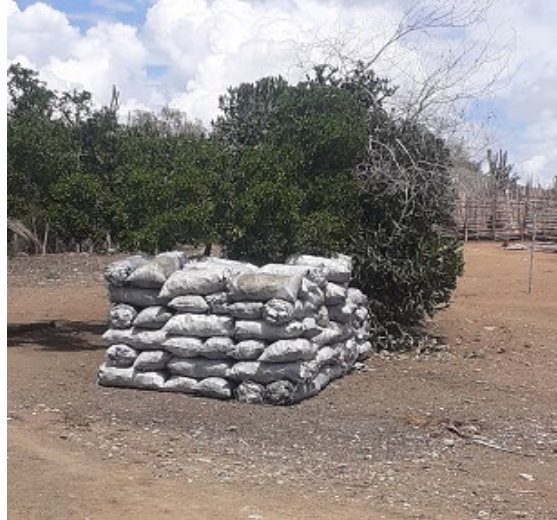
Figura 5. Envasado del carbón vegetal después del proceso productivo.

contaminantes y no representaran un riesgo para la calidad del producto.