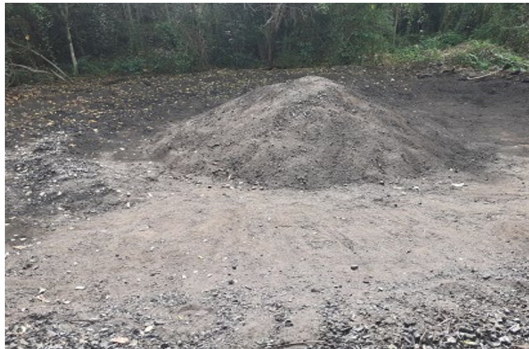
Figura 4. Situación final del proceso.

De esta manera, el proceso aseguraba la producción de un carbón vegetal de alta calidad.