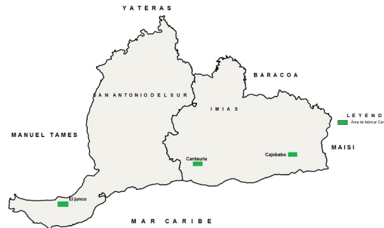
Figura 1. Principales puntos donde se localizan los cultivos para la producción de carbón vegetal.

Respecto a la caracterización de los residuos en laboratorio en mufla 550°C, se seleccionaron muestras de residuos forestales procedentes de árboles de la Reserva Ecológica Hatibonco (Municipio de Caimanera). Los residuos forestales consistieron en ramas de las especies Ceratonia silicua (algarrobo), Cedrela odorata (Cedro), Hibiscus elatus (Majagua) y Erythrina spp (Búcaro) procedentes de la poda realizada.