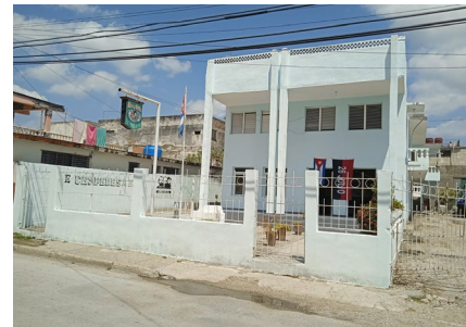
Empresa Agroforestal Baracoa. Empresa Agroforestal Imías. Empresa Flora y Fauna de Guantánamo.

En la figura 1 aparecen reflejados los principales puntos del sistema geográfico, donde se localiza los cultivos, principalmente el marabú para la producción de carbón vegetal en la provincia de Guantánamo.